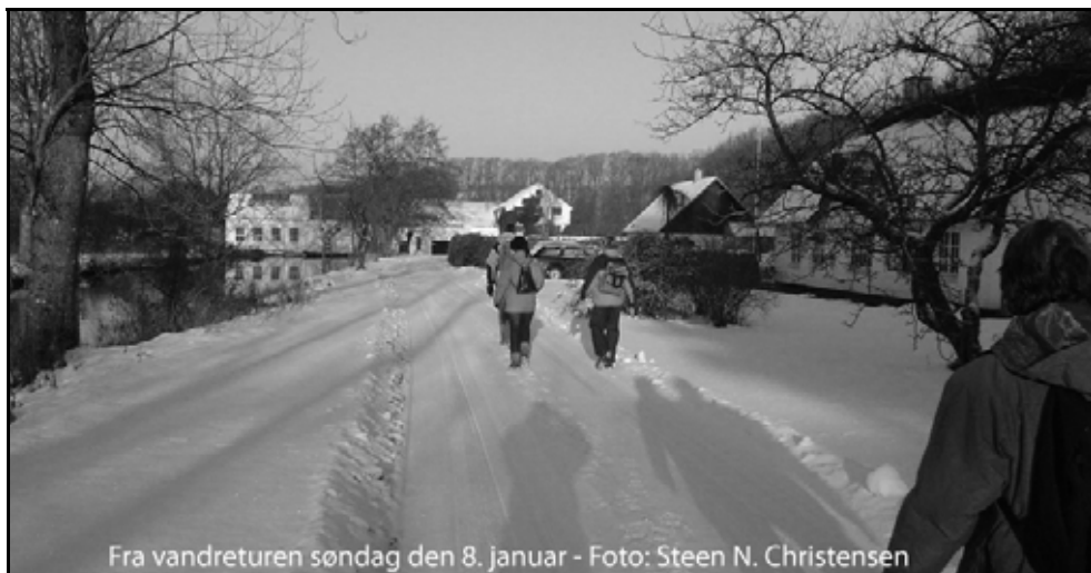
Fra vandreturen søndag den 8. januar