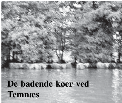
De badende kører ved Temnæs

En af de rigtig hyggelige oplevelser er, når vi kommer forbi det langhårede kvæg (ja de har nok et rigtigt navn) ved Temnæs. De kan ses og nydes både fra Åkandevigen og fra den anden side, når de sindigt står i vand til maven og kigger efter os.